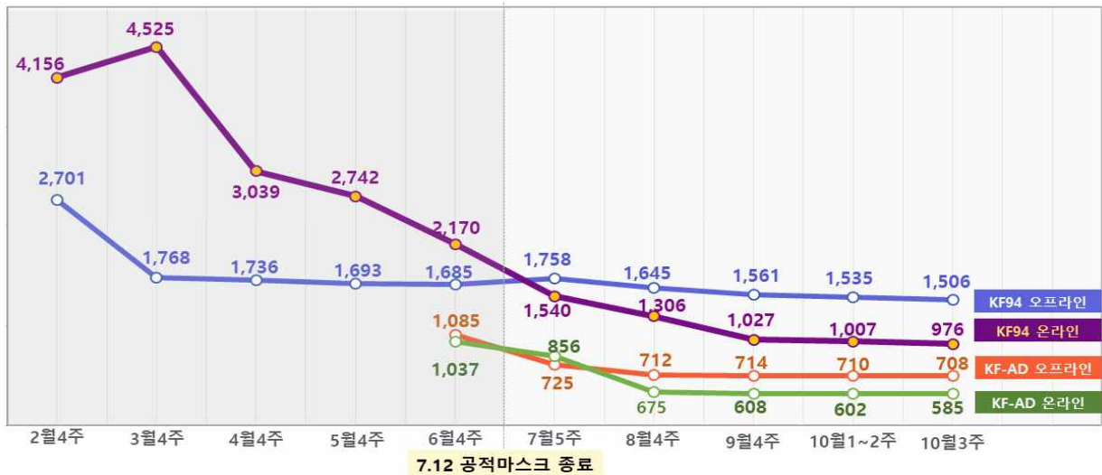
< 마스크 가격 동향(단위: 원) >