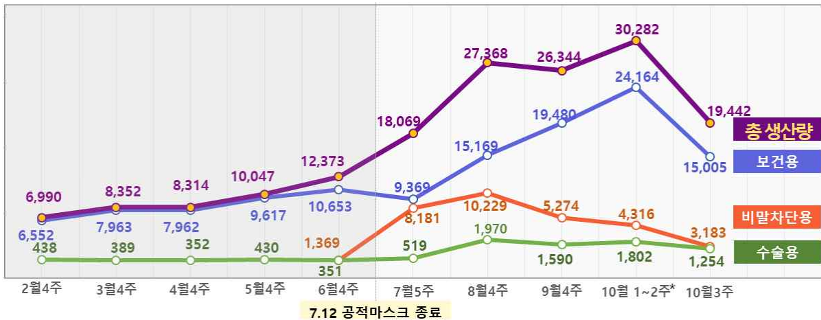
< 마스크 생산 동향(단위: 만 개) >

* 9.30.(수)~10.4(일) 5일간 추석연휴로 10월 1~2주를 합산