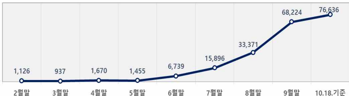
< 마스크 생산업체 보유 재고 동향(단위: 만 개) >

* 10.18. 현재 총 1,343건(보건용 437건, 수술용 258건, 비말차단용 648건)의 심사 진행 중