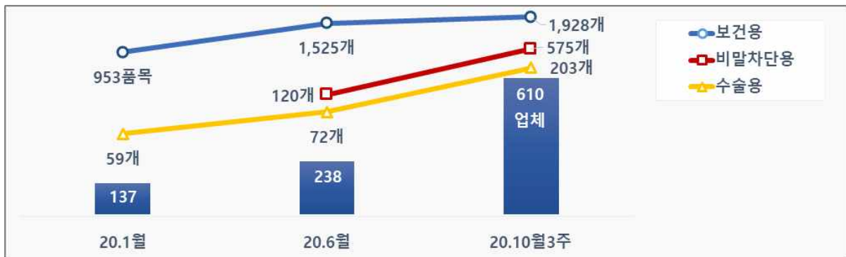
< 국내 마스크 생산업체, 허가품목 수 동향 >

* 10.18. 현재 총 1,343건(보건용 437건, 수술용 258건, 비말차단용 648건)의 심사 진행 중