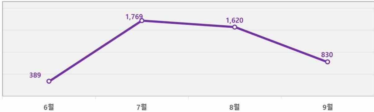
< 마스크 수출량 동향(단위: 만 개) >